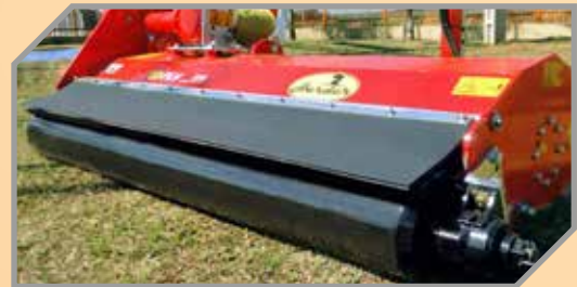
Contenção de poeira com aleta de borracha.