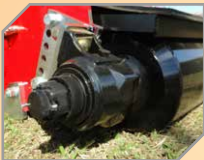
Rolo de apoio com sistema de mancal à óleo.