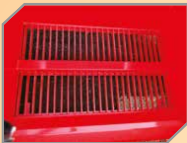
Caixa de armazenagem com grelhas.