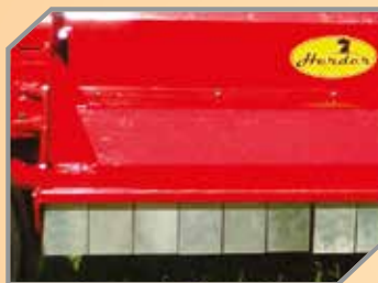
Aletas dianteiras para proteção contra lançamento de objetos.