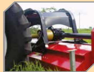
Cabeçalho de engate duplo, categoria II e III.