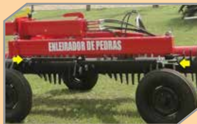
Barras traseiras para fácil alinhamento dos pneus.