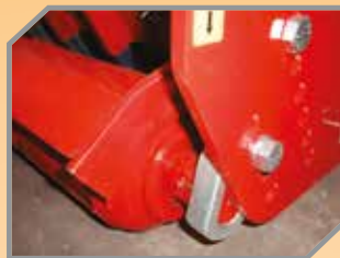
Rolo de apoio traseiro com sistema exclusivo de vedação, ponto de lubrificação e regulagem de altura de corte.