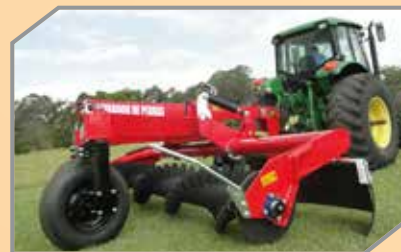
Sistemas de proteção com aletas de borracha, varão e furo.