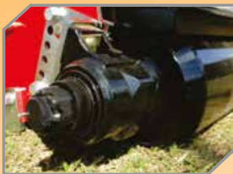
Rolo de apoio com sistema de mancal a óleo.