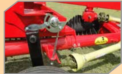
Acoplagem de cardam para transporte.