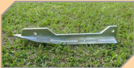
Ski com base de apoio.

Equipamento desenvolvido principalmente para o mercado de rodovias. Possui estrutura diferenciada e reforçada, projetada com chapa de 1/4".