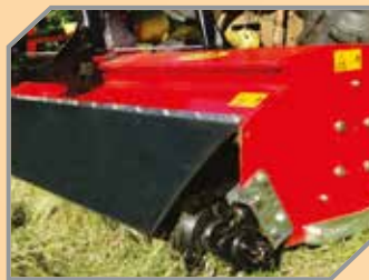
Sistema de contenção de poeira.