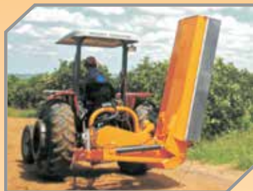
Posição de transporte e corte com ângulo positivo de até 90°.