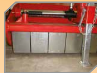
Aletas dianteiras para proteção contra lançamento de objetos.