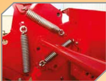
Molas de alta resistência