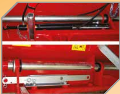
Descolamento lateral mecânico ou hidráulico. *Opcional