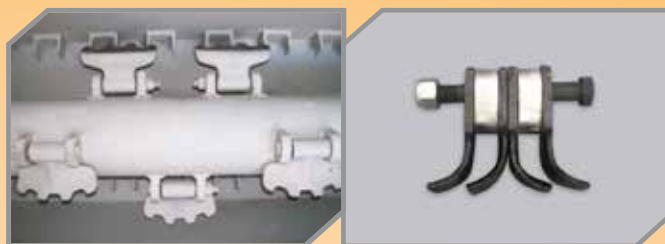
Martelos dentados para melhor trituração com contra facas internas. *Opcional de sistema duplo de contra facas, com facas reversíveis e oscilantes com tratamento de superfície para maior durabilidade.