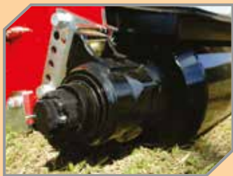
Sistema de mancal à óleo.

Obs: É aconselhável a não permanência de pessoas próximas ou sobre qualquer equipamento em operação.