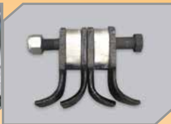
Martelos dentados para melhor trituração com contra facas internas. *Opcional de sistema duplo de contra facas, com facas reversíveis e oscilantes com tratamento de superfície para maior durabilidade.