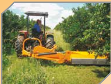
Deslocamento hidráulico super lateral.