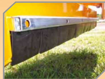
Aletas dianteiras para proteção contra lançamento de objetos.