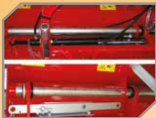
Deslocamento lateral mecânico ou hidráulico.*Opcional