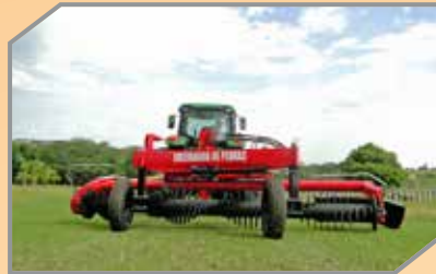
Rolo com tratamento de solda dura promovendo diminuição de desgaste.