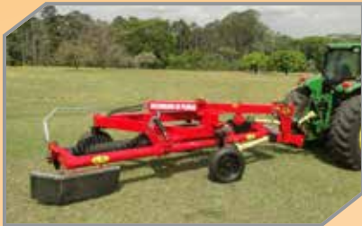
Sistema de transporte com largura de 2,3 metros.